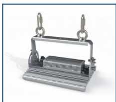
Крепление Рым-болт М6 Unit (комплект)